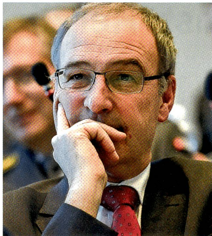
Bundesrat Parmelin stattete der DV der SOG in Chur seinen ersten Besuch ab.