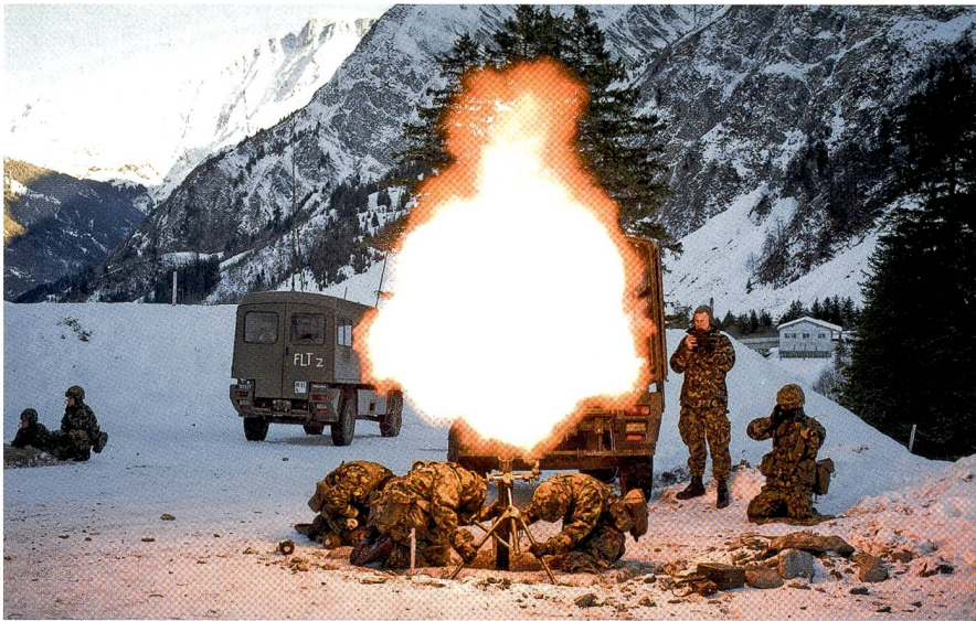
Abschuss des 8,1-cm-Minenwerfers.