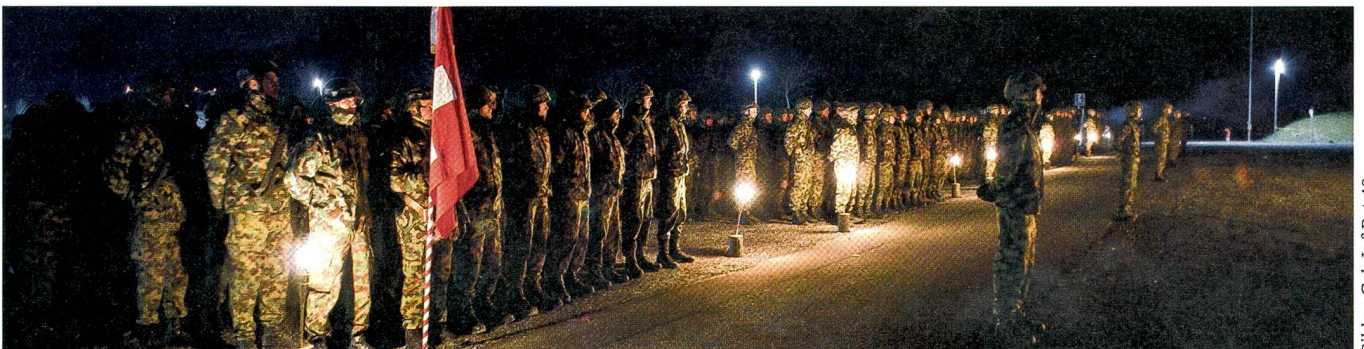
Fahnenübernahme am Ufer des Walensees. Das Inf Bat 48 beginnt seinen WK in würdiger Form.