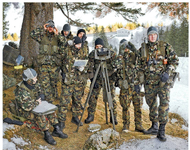
Minenwerferbeobachter an der Arbeit.

zuschätzen gilt. Mit der anrückenden Truppe kommt nun auf einmal Leben auf im zuvor so ruhigen Äuli.