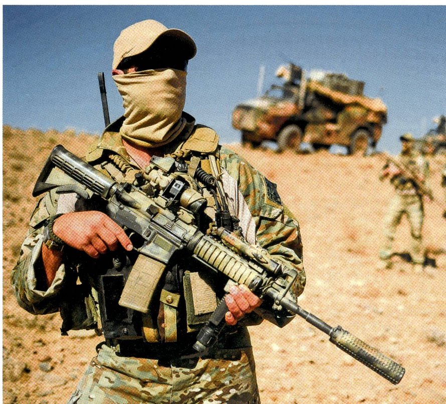
Die britische SAS-Truppe gehört zu den besten Sonderstreitkräften der Welt.

Seit Menschengedenken erzielt der SAS auf der ganzen Welt Erfolge. Die britische Regierung hält The Regiment und dessen Einsätze in der Regel geheim. Aus dem Irak ist bekannt, dass zwischen 50 und 60 Mann die Royal Air Force unterstützen. Mit der Ausdehnung der britischen Luftlein-