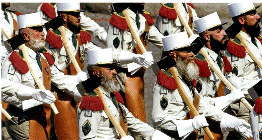
Die französische Fremdenlegion umfasst Soldaten aus 130 Nationen, auch Schweizer.