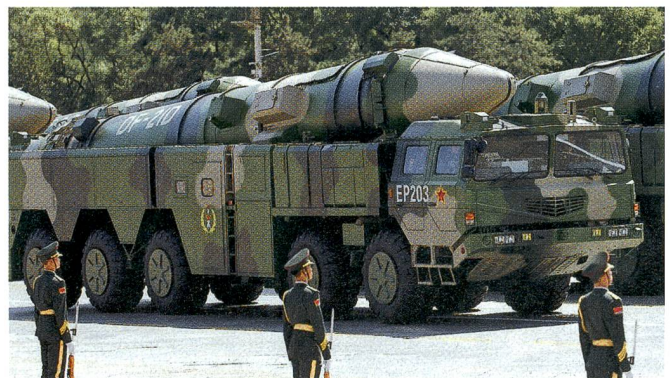
Die ab Land eingesetzte ballistische Rakete des Typs Dongfeng DF-21D, die vor allem für amerikanische Flugzeugträger im Pazifik gefährlich werden könnte.