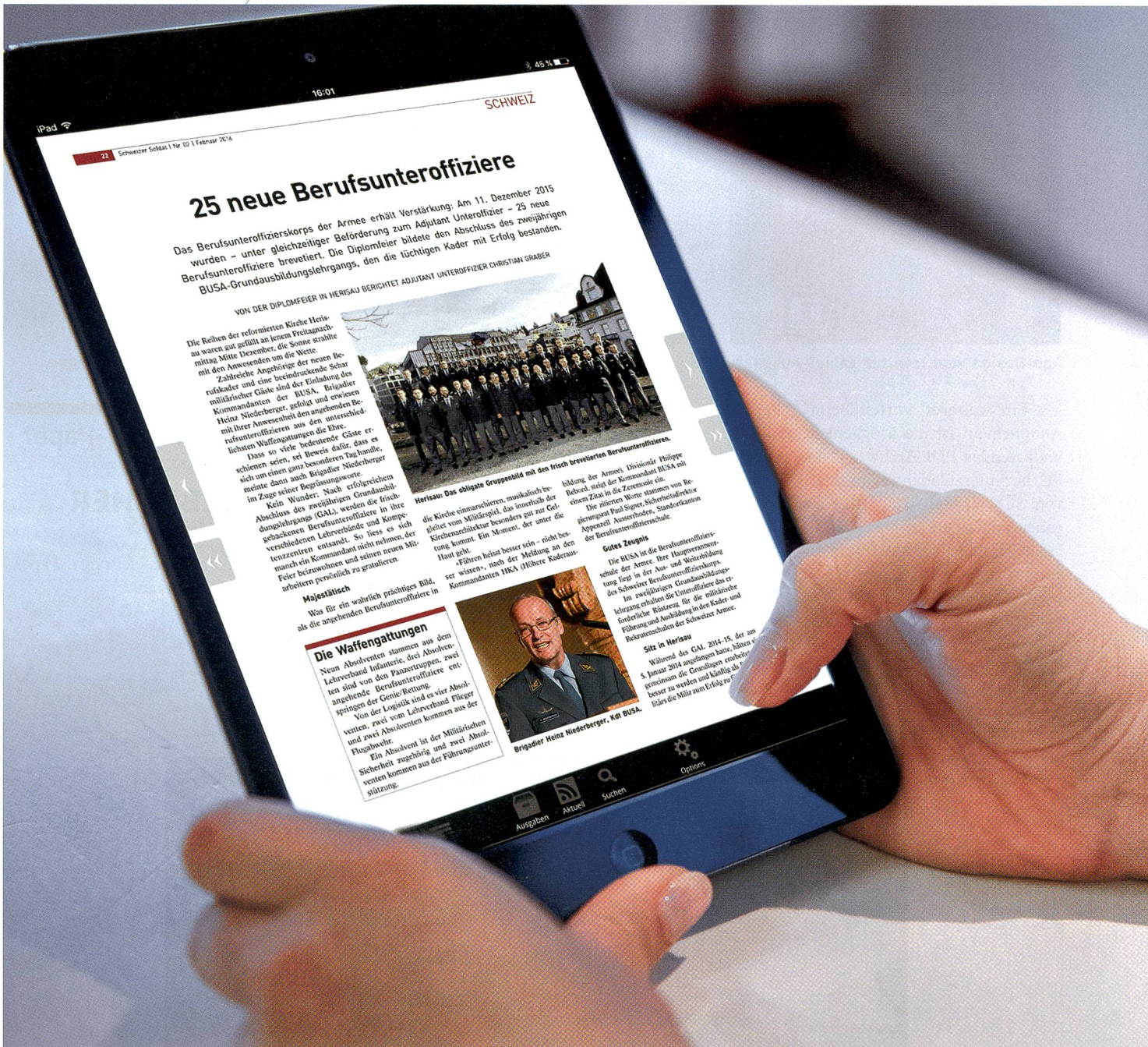
Der SCHWEIZER SOLDAT wird im gewohnten Layout auch auf dem Tablet serviert. Auf dem iPad sogar mit einer eigenen App.

Schrot und Korn wie unsere neue digitale Ausgabe.