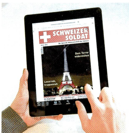
Blättern mit tippen und wischen.