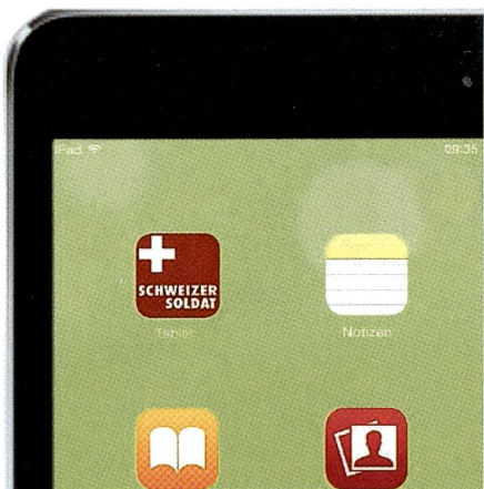
App-Design vom Icon für Tablet-Ausgabe.