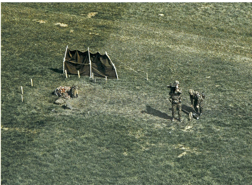
Ziel erfasst: STINGER-Feuereinheit im Einsatz.