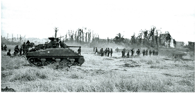
Panzer M4 «Sherman» und Infanterie auf dem Vormarsch Richtung Caen, Normandie Juli 1944.

So aber trafen Montgomery und Model zu einer weiteren Panzerschlacht aufeinander: Ende 1944 in den Ardennen!