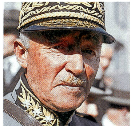
Henri Guisan, hochverehrter General.