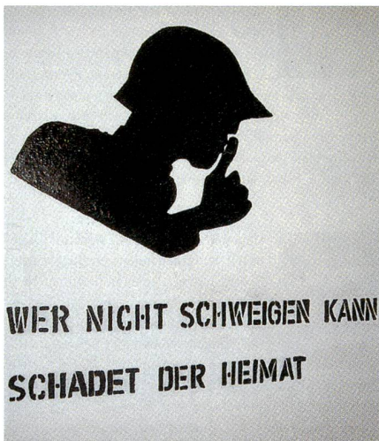
Die Losung des Tages.

Immerhin darf nicht verschwiegen werden, dass Deutschland, respektive sein