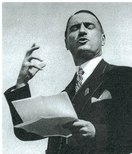
Marcel Pilet-Golaz musste zurücktreten.