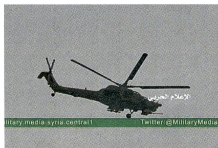
Das erste (unscharfe) Bild eines Russen-Helikopters – ein Mi-28 – über Palmyra.

Der Mi-28 trägt seinen NATO-Code HAVOC (Verwüstung) und seinen russischen Namen Notschnoj Ochotnik (Nacht-