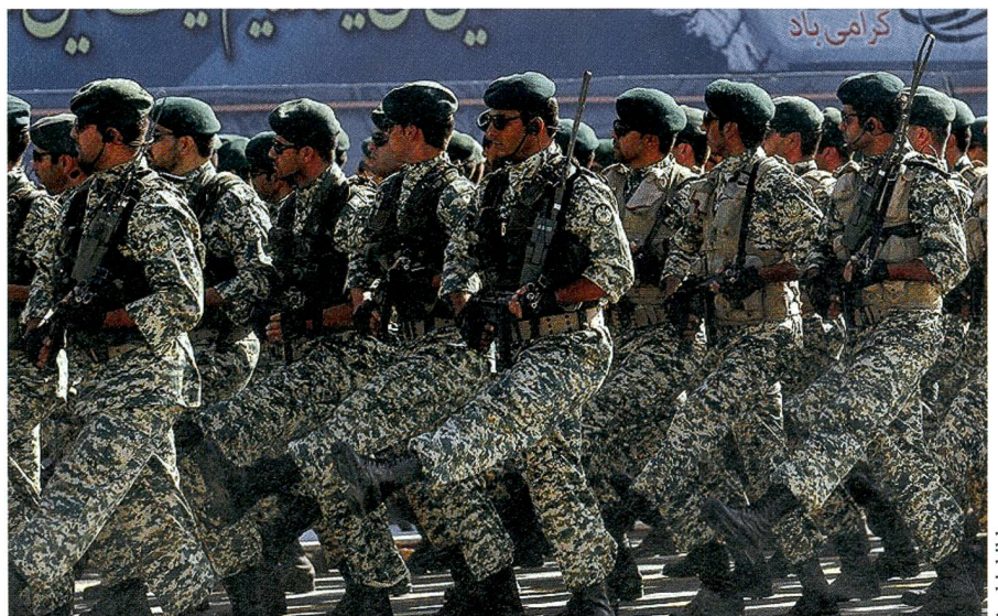
Die Revolutionswächter, die Pasdaran, bilden die Speerspitze der iranischen Armee.