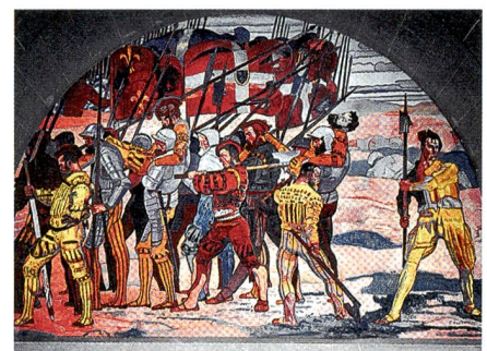
Hans-Rudolf Fuhrer: Die Schlacht von Marignano 1515 Eine militärische Betrachtung