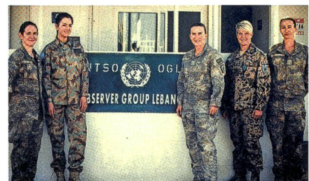
Direkt an der Grenze in Naqoura.