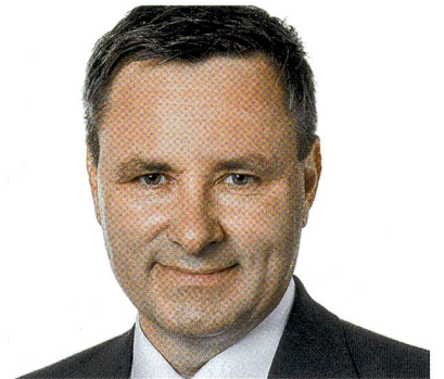
Nationalrat Werner Salzmann.

Die Zeitschrift SCHWEIZER SOLDAT bietet gute und aktuelle Information. Sie ist damit ein wichtiges Organ sowohl für Armeeingehörige wie auch für Sicherheitsinteressierte. Die Redaktion leistet damit ei-