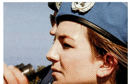
Im UNTSO-Einsatz an der Grenze.