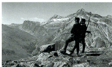
Stellung auf dem Splügen.

Die Kernaussstellung wurde vom Verein «Die Schweiz im Ersten Weltkrieg» konzipiert und war als Wanderausstellung in Basel, Zürich, St. Gallen und Neuchâtel zu sehen. Sie deckt den nationalen Kontext