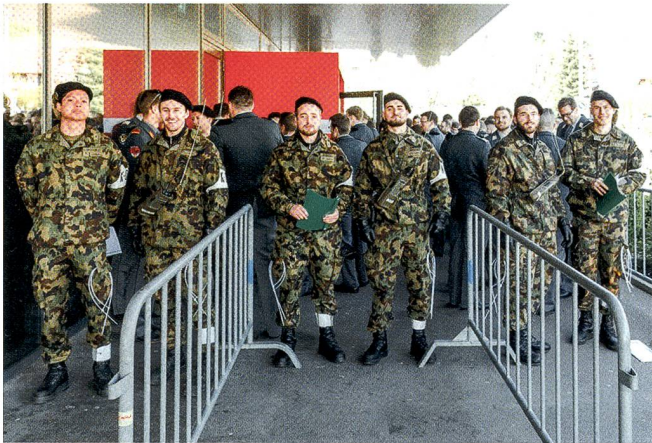
Da kommen Bösewichte keinesfalls durch: Stadthalle Dietikon.