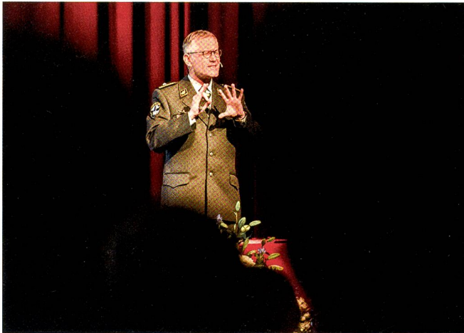
Ganz genau interpretiert Brigadier Alain Vuitel die Weltlage.