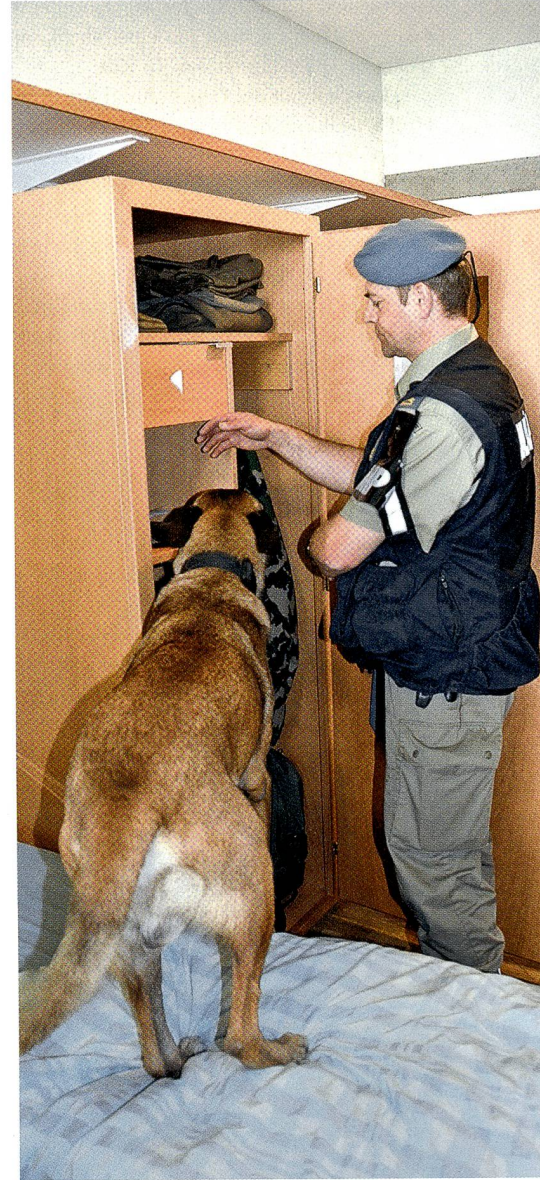
Drogenhund Ares durchsucht einen Schrank.