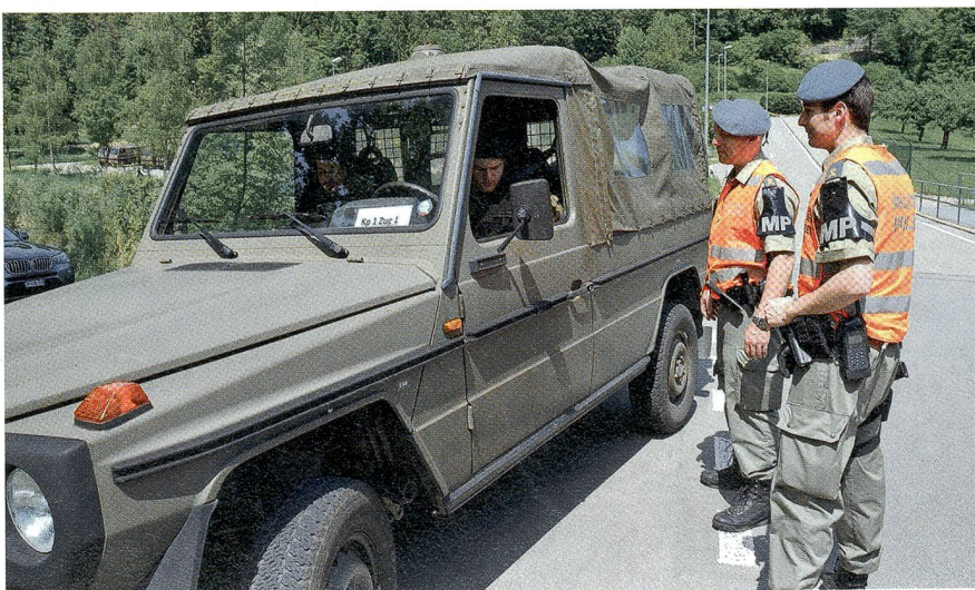
Fahrzeugkontrolle auf dem Waffenplatz Reppischtal.