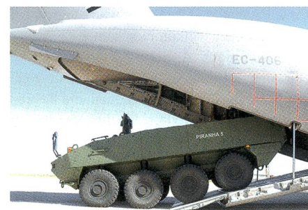
Verlad eines Piranha V in eine A400M.

Im Rahmen dieses Testverfahrens wurde der PIRANHA 5 vollständig in den Frachtraum gefahren und entsprechend den Lufttransportbestimmungen fixiert. Die Besatzung war problemlos in der Lage, das Fahrzeug in den Airbus A400M zu verladen. Der Frachtraum bietet Platz für einen PIRANHA 5 und 29 vollständig ausgerüstete Soldaten. Das Ziel war, den Verlad eines PIRANHA 5 in den Frachtraum ohne spezielle Vorbereitungen als Teil eines