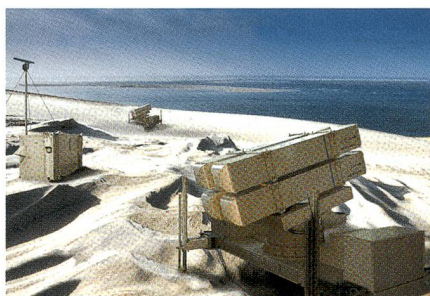
Küstenschutzsystem MBDA Marte Mk 2.

Beide Munitionen sollen im autonomen Modus mit ihren eigenen Radaren bzw. durch Unterstützung mit einem Datenlink den Küstenschutz sicherstellen. Ebenfalls für dieses System sind – zur Über-