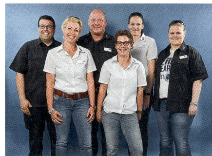
Das HAIX-Team in Egerkingen.

Direkt nach dem dorfseitigen Kreisel beim Autobahnkreuz in Egerkingen sticht rechterhand der neue Verkaufsladen mit dem HAIX-Logo an der Fassade ins Auge. Ein moderner Bau mit grossen Schaufen-