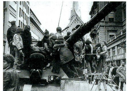
300 000 Gäste an der Wehrvorführung.

Einen weiteren Höhepunkt bildete die Wehrvorführung 1979 in Zürich. In seiner ihm eigenen lebhaften Weise schreibt Divisionär Seethaler im Buch des FAK 4: «Neue Lage! Der Korpskommandant hat entschieden: Im Anschluss an das Korpsmanöver 1979 werden keine Divisionsdefilees durchgeführt.» Mit seinem Stab habe er, Seethaler, dann ein Brainstorming durchgeführt – mit dem Ergebnis: «Wir dürfen nicht nichts tun.» Daraus sei die Idee der Wehrvorfüh-