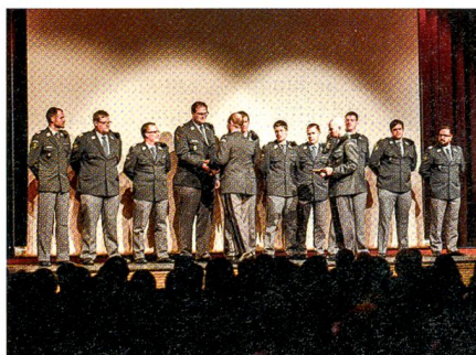
Zehn Einheitskommandanten gewürdigt.