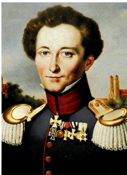
Der preussische Militärphilosoph Freiherr Carl von Clausewitz (1780–1831).

Mit seiner Zweck-Ziel-Mittel-Relation und dem Mass der Mittel zwingt er den Strategen, methodisch zu beurteilen, ob ein Krieg sinnvoll sei und welche Mittel zum Erreichen der vorgegebenen politischen