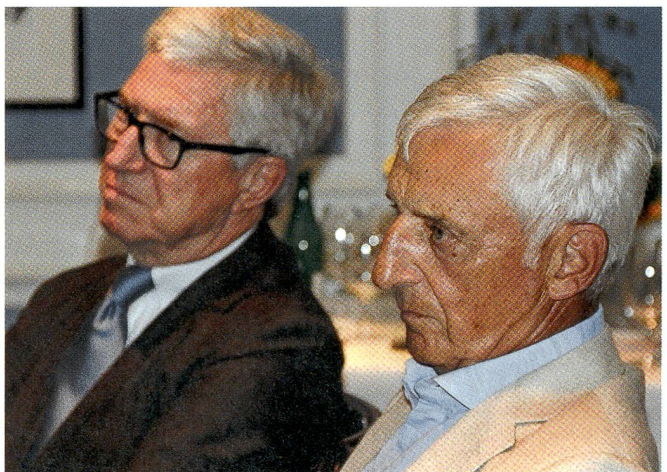
Intensive Anteilnahme und Reflexion.