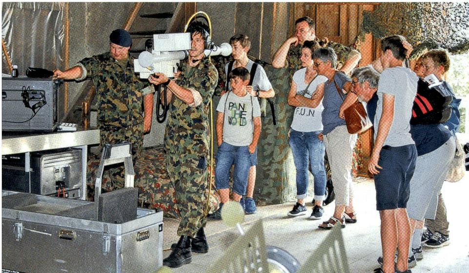
STINGER-Training, gut beobachtet.