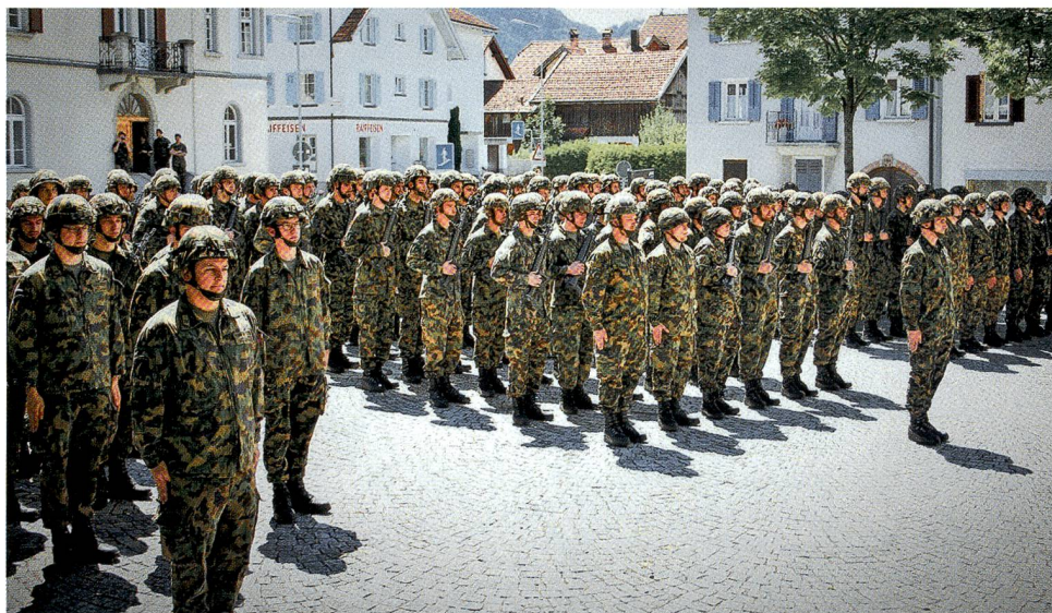
Standartenübernahme L Flab Lwf Abt 9 auf dem Dorfplatz Bonaduz.

So war es am Folgetag kaum überraschend, dass das «Bündner Tagblatt» auch ihre Leserschaft mit einem Bericht unter