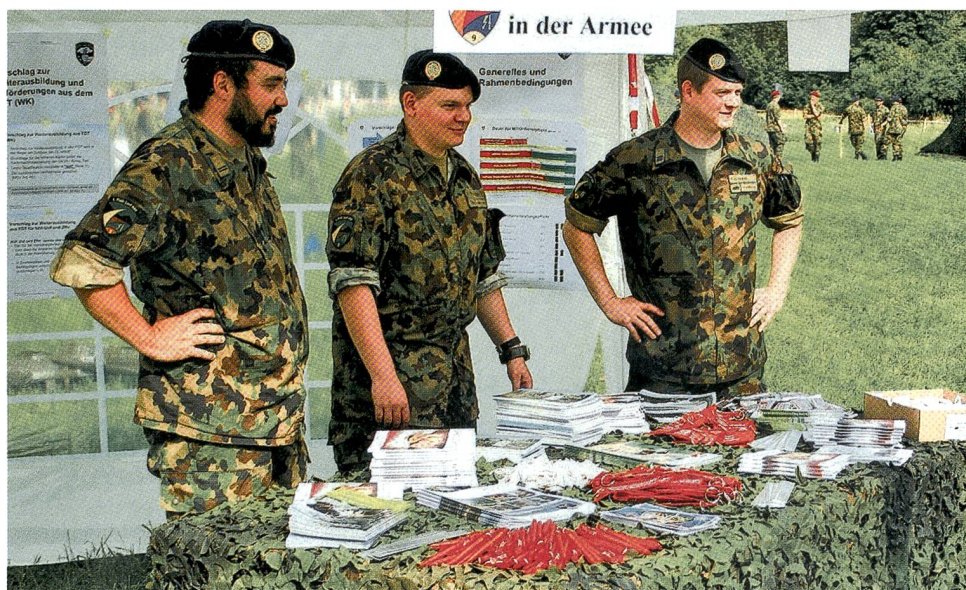
Kader und Soldaten der Abteilung bereit für Fragen.