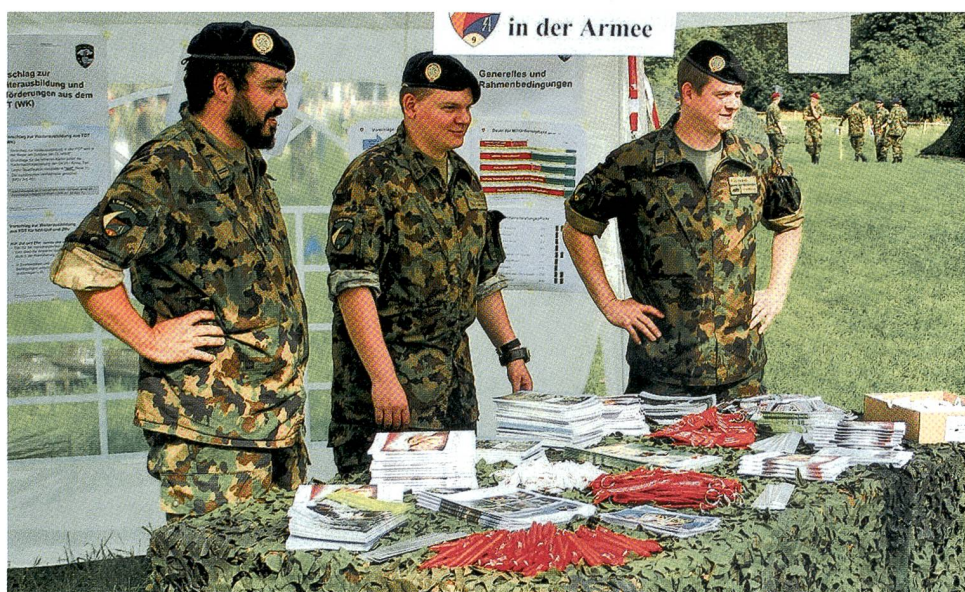
Kader und Soldaten der Abteilung bereit für Fragen.