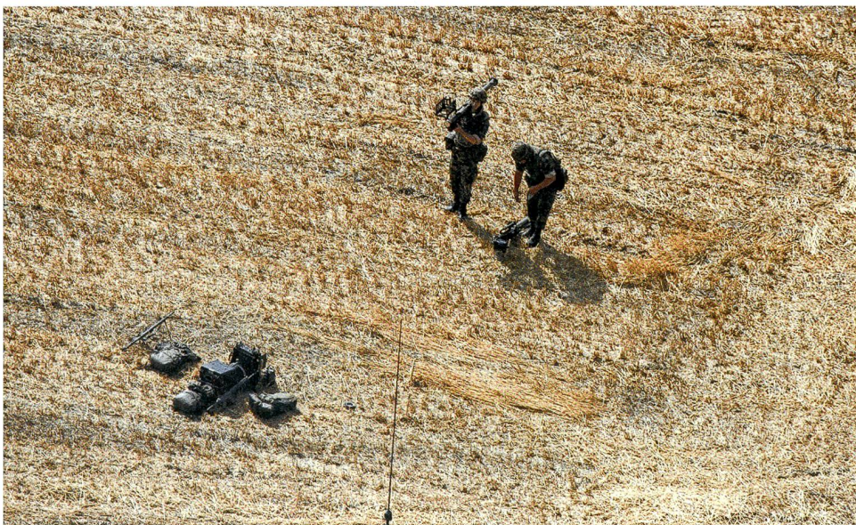
STINGER-Trupp im Einsatz.

dem Titel «In Bonaduz allzeit bereit» über die Anwesenheit der Abteilung im Bündnerland entsprechend informierte und die wichtigsten Passagen aus der Rede des Abteilungskommandanten wiedergab.