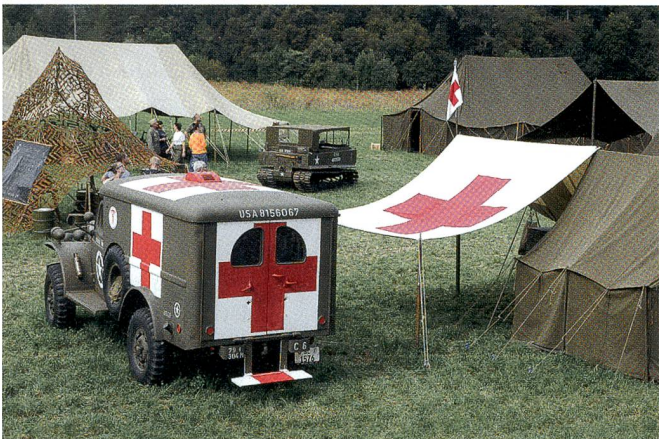
Das Feldlazarett wie anno dazumal.