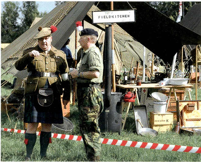
Pittoreske Uniformen – echt und aus der Zeit.