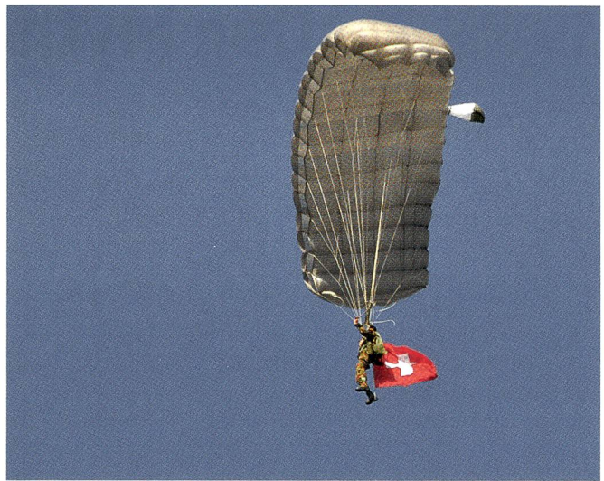
Fallschirmspringer – immer ein Publikumsmagnet.