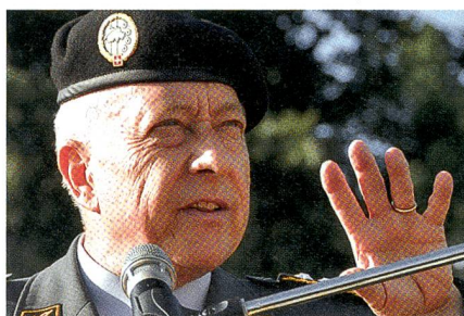
CdA Blattmann mit «standing ovations».

Dem werden auch die rund 1000 «Aussteller» zustimmen, die zu einem grossen Teil in den Militärzelten oder unter Militärblachen übernachteten.