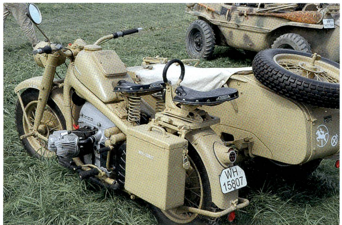
300 Motorräder in allen Variationen sind zu bestaunen.

Flugzeugs, auch Arbeitstier oder flying jeep genannt, wie es in der Normandie und in Pearl Harbor eingesetzt wurde. Das alles auf einem flab-geschützten Feldflugplatz!