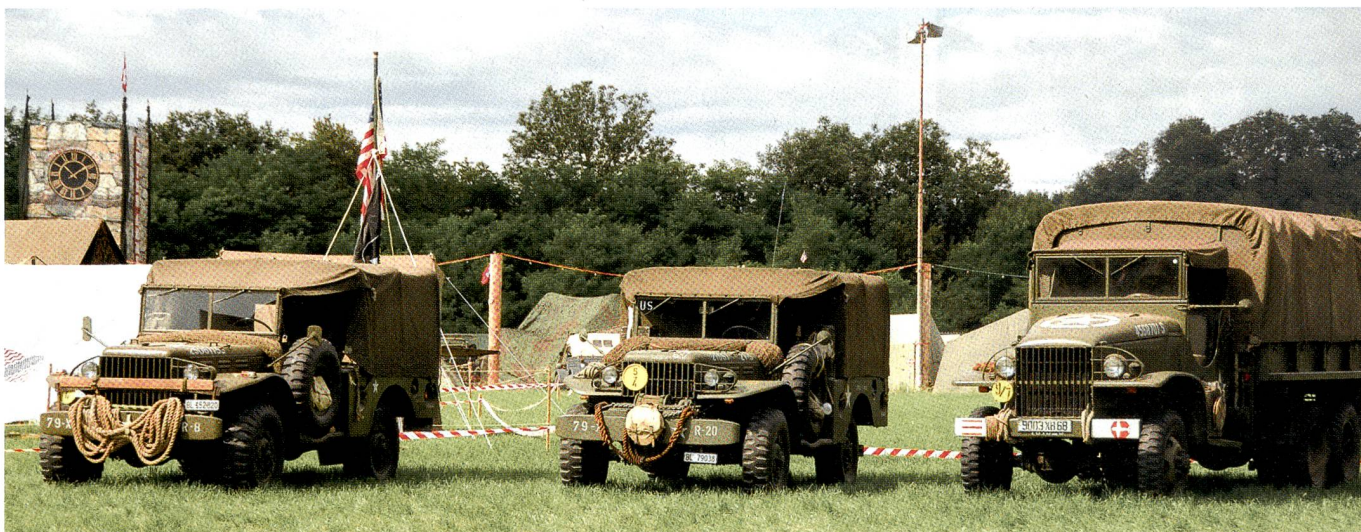
Dodge, GMC und Jeeps gehören zur D-Day-Erinnerung, zum Gedenken an die Invasion vom 6. Juni 1944.