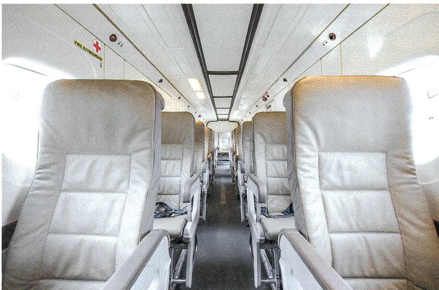
Der Blick in die überaus geräumige, komfortable Kabine der Dornier-228-Maschine.