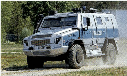
Personentransportfahrzeug Survivor R.

Gemeinsam mit Achleitner präsentierte RMMV ein kostengünstiges geschütztes Personentransportfahrzeug. Basierend auf einem 242 kW starken Lkw-Fahrgestell