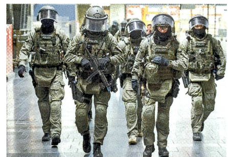
Berlin: Ursula von der Leyen handelt – Neue Antiterrortruppe im Einsatz