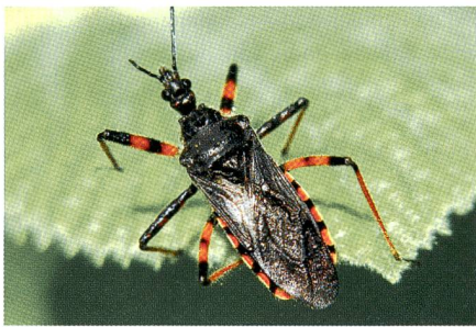
Richtige Wanze (nicht Geheimmikrophon).

Die Massnahmen zur Entwesung sind eingeleitet. Dazu gehört unter anderem eine gründliche Körperreinigung und die Reinigung sämtlicher Textilien. Die Reinigung von Textilien wird unter anderem