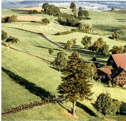
Zwischen dem Gubel und Menzingen.

Das Landschaftsbild auf dem Titelblatt der Doppelausgabe findet Beifall unter unseren Leserinnen und Lesern. Mehrere Fragen: Woher stammt die Aufnahme?