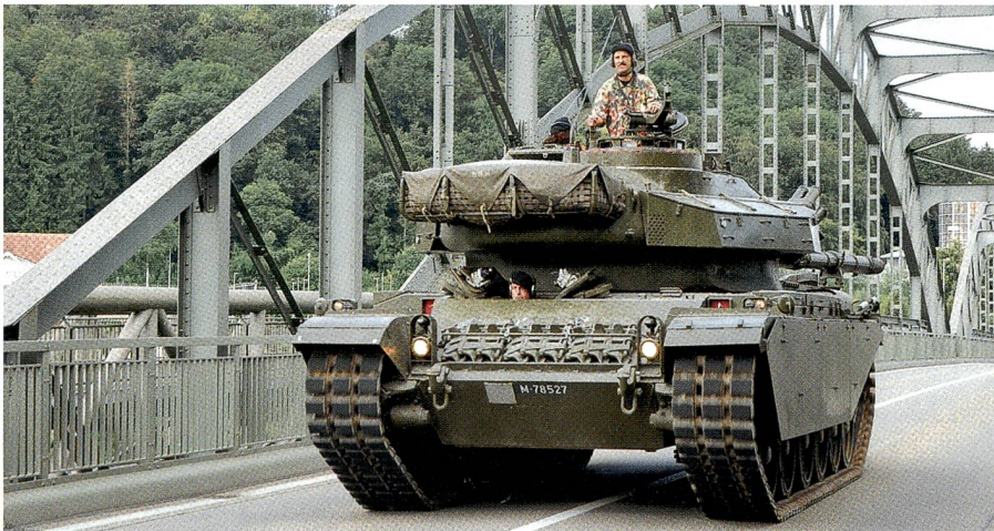
Der legendäre Centurion-Panzer der Schweizer Armee – Lesen Sie Seiten 37–39.