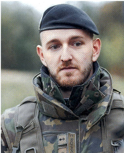
Auf die Unteroffiziere kommt es an!