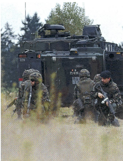
Panzergrenadiere im Schutz des Panzers.