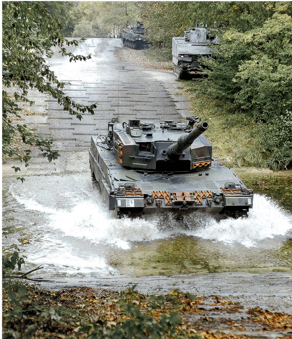
Kühne Durchquerung der Murg. Oben warten ein Schützenpanzer und ein weiterer Leo.