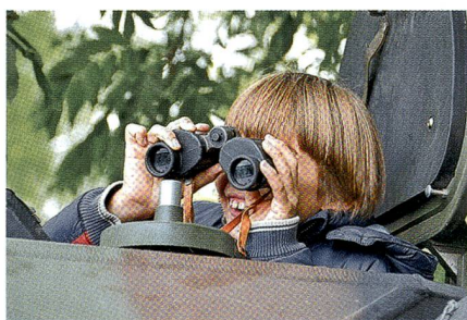
Die Aufklärerin im Eagle Spähpanzer.