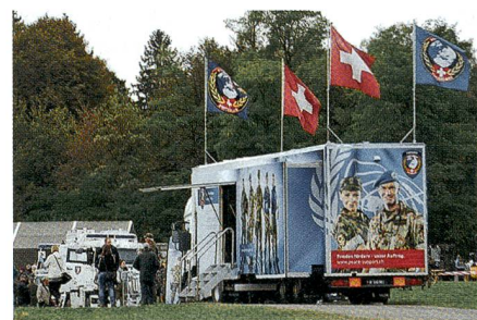
Auch SWISSINT ist sehr gut vertreten.