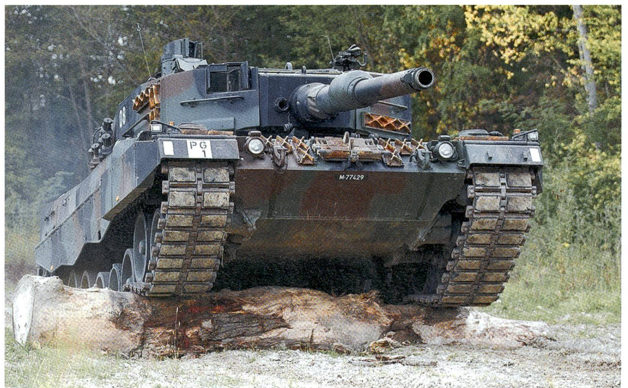
Kraftvoll überwindet der 56 Tonnen schwere Kampfpanzer Nummer 08 das Hindernis.