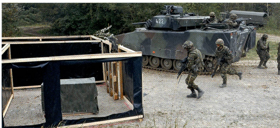
Panzergrenadier-Angriff im überbauten Gelände. Hinten der Schützenpanzer 2000.