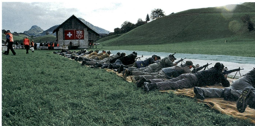
Wenige Meter neben der Hauptstrasse: die Gewehrscützenlinie.