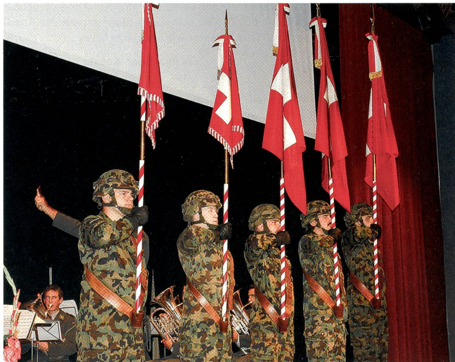
Die Suisse romande hat Sinn für Repräsentation: Die Feldzeichen der Ter Reg 1.

Luxemburg, erklärte die Sicherheitslage in und an den Grenzen von Europa.