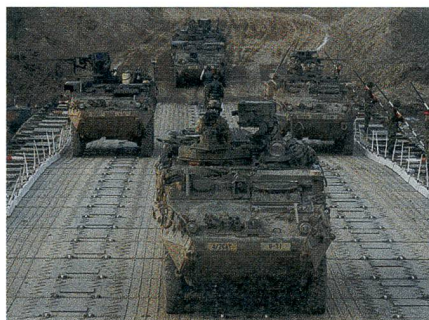
Stryker: Flussübergang in Rumänien.