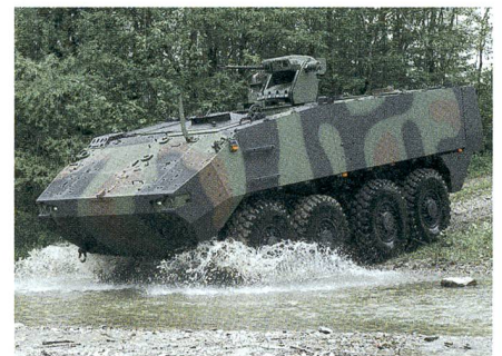
Versuch: Piranha-3 mit 20-mm-Kanone.