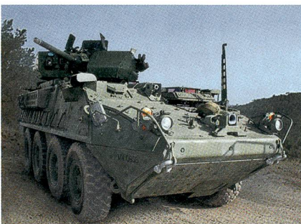
Der neue Dragoon von General Dynamics.