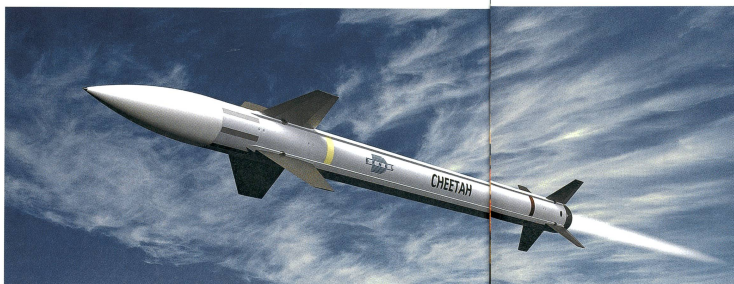
Wie der Name Cheetah der Lenkwaffe schon sagt, ist sie in der Lage, kurze Strecken mit hoher Geschwindigkeit zurückzulegen. Sie ist allwettertauglich und dient dem Kampf gegen C-Ram-Raketen und Granaten.

Fest steht, dass der Kampfpanzer im Landkrieg und in hybriden Auseinandersetzungen nach wie vor ein Schlüsselement ist. Aus diesen Gründen kauft Deutschland mehr als 100 verkaufte Leopard wieder zurück.