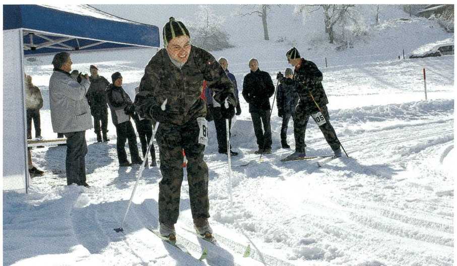
Aus vergangenen Zeiten: Der Bachtel-Winterwettkampf mit Langlauf als Disziplin.