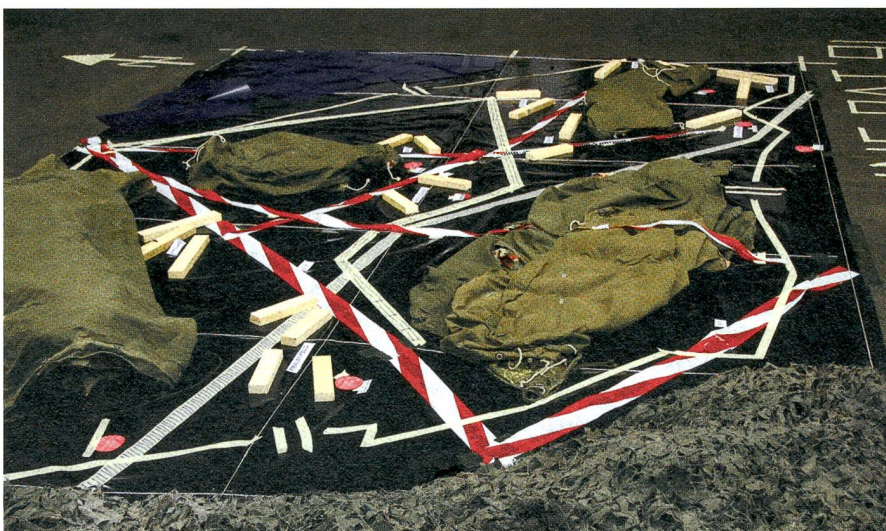
Geländemodell des Geb Inf Bat 91: Der Thurgauer Seerücken.