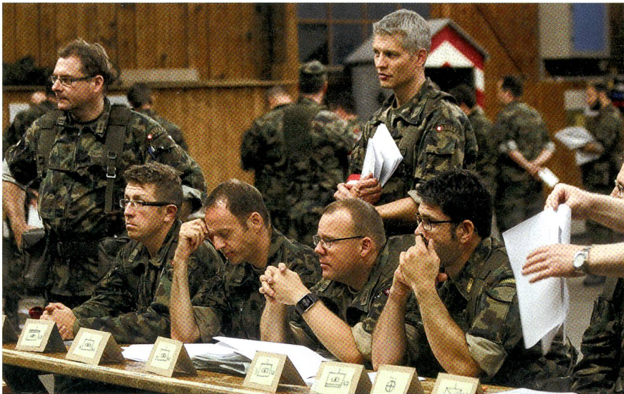
Der Stab Art Abt 47 bei der Befehlsausgabe.