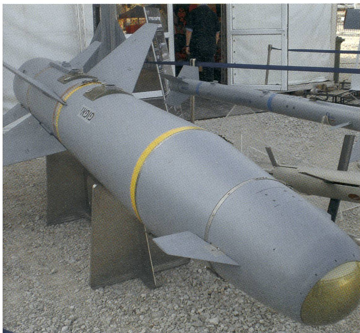
Popeye-Luft-Boden-Rakete von Rafael.