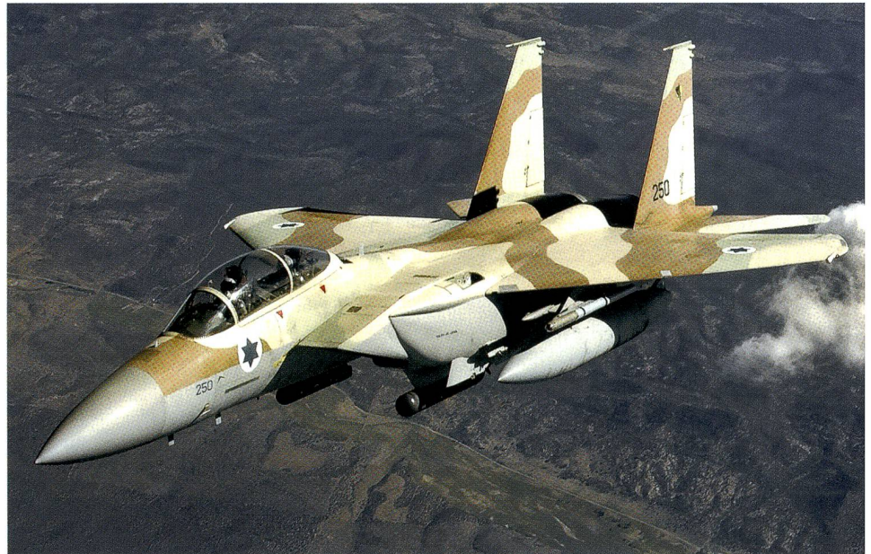
F-15 der israelischen Luftwaffe. 2016 erhält Israel den F-35.

Wohl hatten Präsident Putin und Premier Netanyahu noch im September Absprachen getroffen, die den Zusammenprall der russischen und der israelischen Luftwaffe verhindern. Dennoch war die Operation vom 11. November 2015 mit einem gewissen Risiko verbunden.