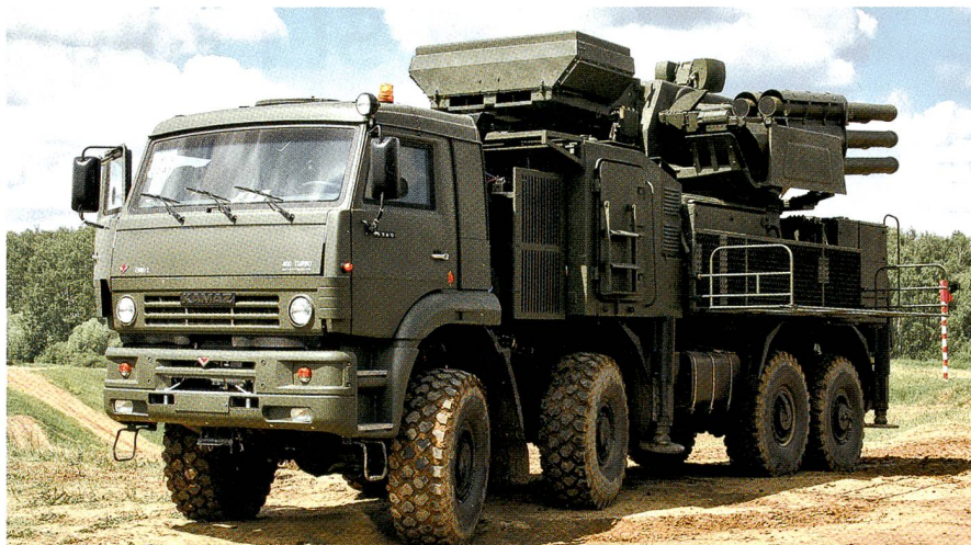
Das russische Flabsystem Pantsir-S1.