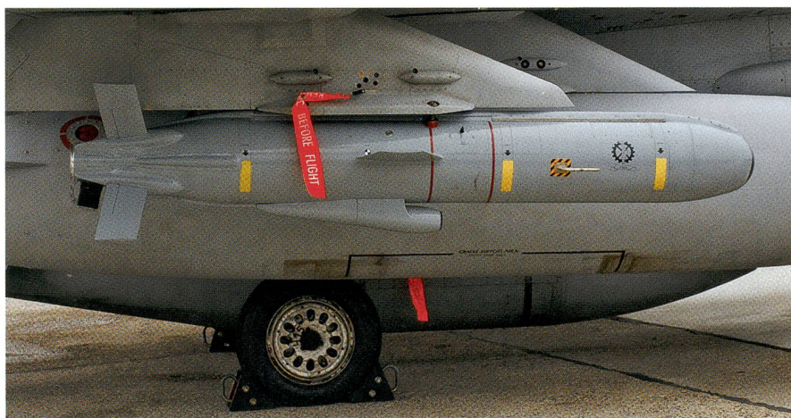
Der Marschflugkörper Delilah von Israel Military Industries.