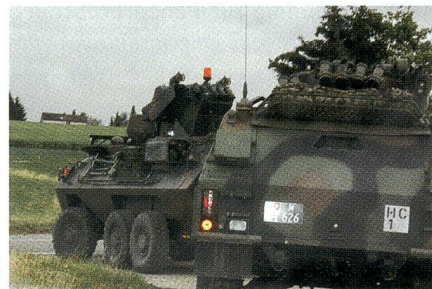
Aufklärer am Werk.

Die Aufklärungsbataillone der beiden Panzerbrigaden 1 und 11 sind in ihrer Be-