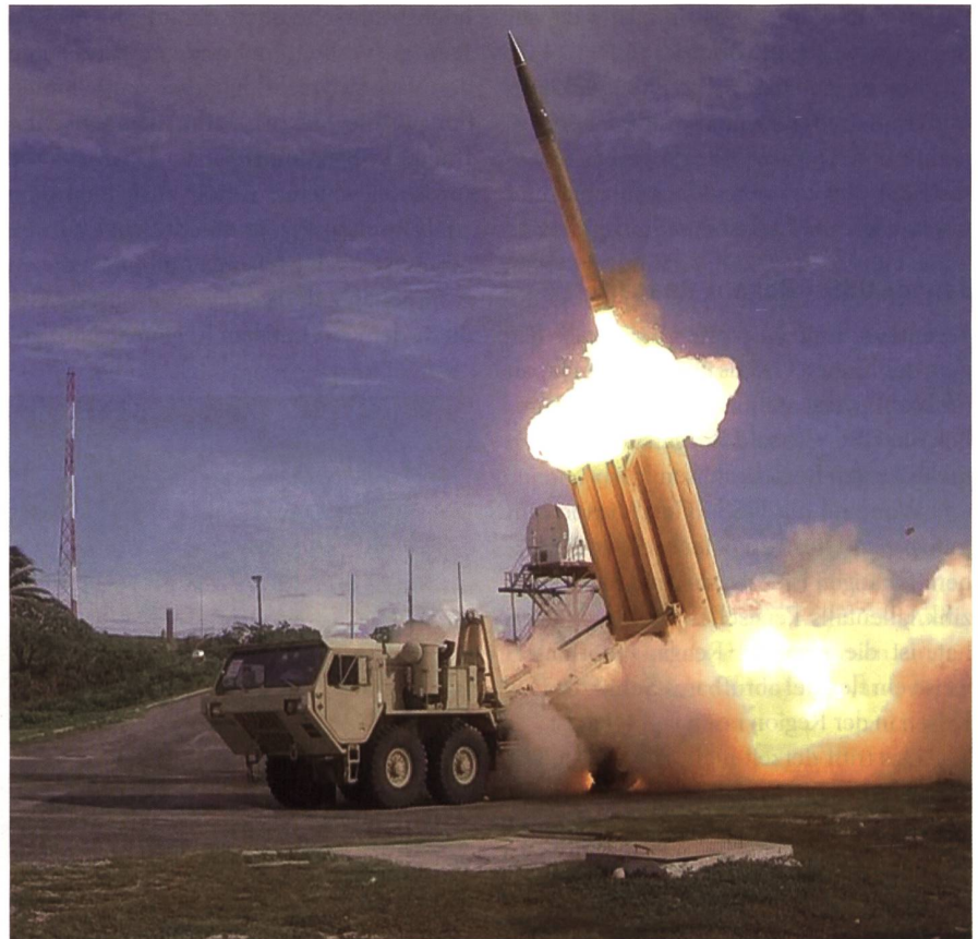
Das THAAD ist ein Raketenabwehrsystem des amerikanischen Heeres gegen feindliche ballistische Raketen, die einen Kriegsschauplatz oder eine Region bedrohen.

In Nordkorea zündelt Kim Jong-un weiter. In der dritten Märzwoche 2017 testeten seine Ingenieure erneut ein starkes Raketentriebwerk – gegen die Resolution des UNO-Sicherheitsrates, die solche Versu-