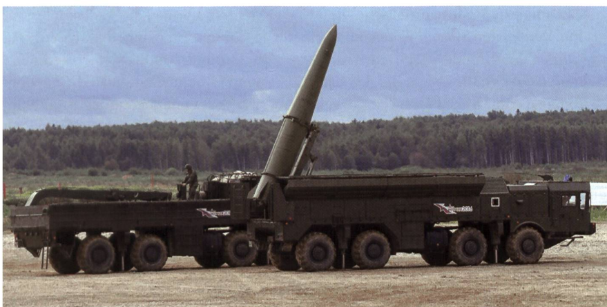
Um nuklear bestückte Iskander-Raketen in Kaliningrad dreht sich Shirreffs Buch.