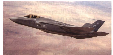
Der F-35A von Lockheed Martin, USA.