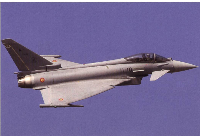
Der Eurofighter weist Erfahrung aus Kriegen auf.