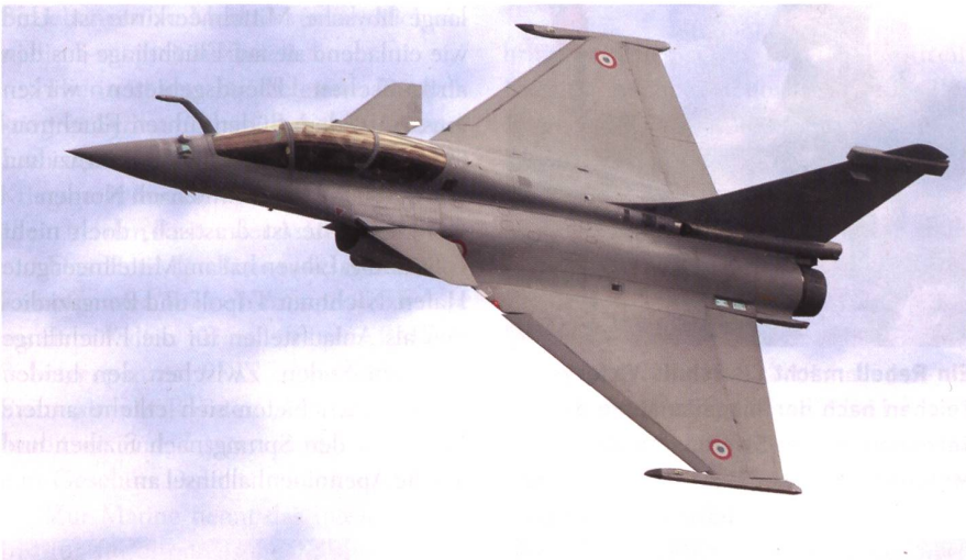
Der französische Dassault Rafale besitzt Kriegserfahrung an mehreren Fronten.