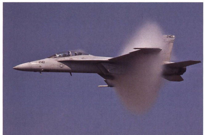
F/A-18E/F Super Hornet von Boeing.