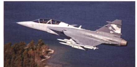
Der schwedische Gripen von Saab.