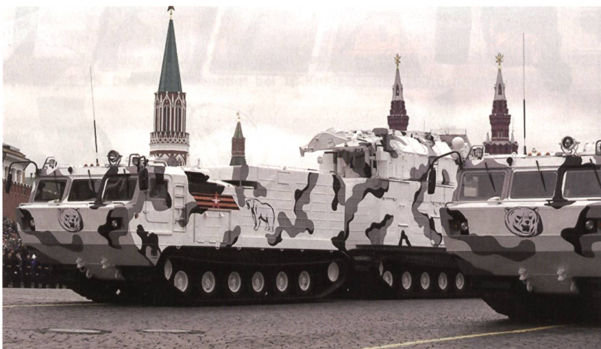
Der Arktis-Transporter Chetra TM-140A führt zusätzlich zur Besatzung acht Soldaten oder bis zu 1000 kg Fracht mit sich. Das Fahrzeug wiegt 11 200 kg, erreicht 45 km/h und hat eine Reichweite von 550 km. Es wird von der 250-PS-Gasturbine YaMZ-236-B2 angetrieben und hält Temperaturen bis zu 40 Grad unter Null aus.