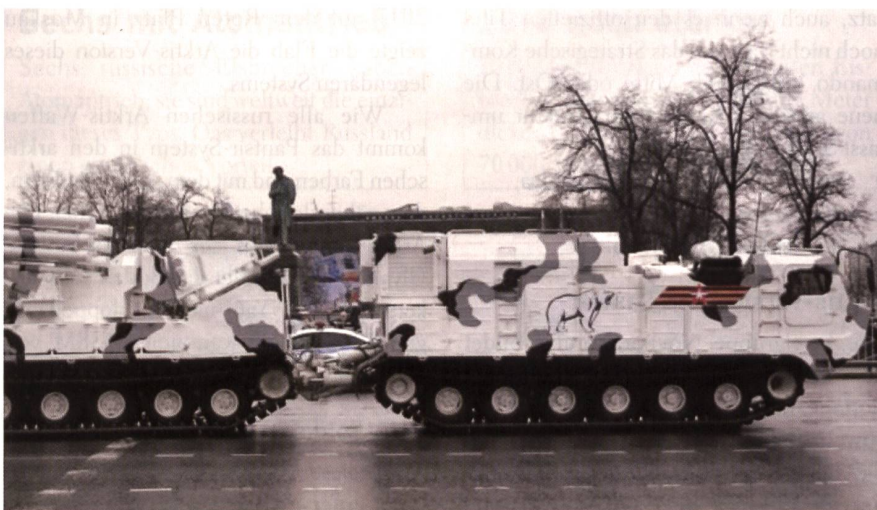
Die Arktis-Version des legendären Flab-Panzers Pantsir-S1 (NATO-Code SA-22 Greyhound). Der Pantsir der Waffenschmiede Ulyanoswk verbindet das Boden-Luft-Raketensystem 95Ya6 mit zwei 30-mm-Flab-Kanonen 2A38M von KBP Tula. Auch dieses Waffensystem kann bei 40 Grad unter Null eingesetzt werden.