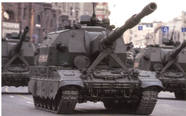
Das neue Geschütz Koalitzija-SW trifft auf 70 km genau.