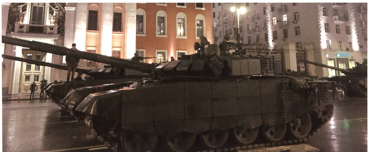
Zwei Kampfpanser warten, bis sie mit ihrem Block, den Panzern der Garnison Moskau, zum Roten Platz abgerufen werden.

Die Einwohner von Moskau kennen das und machen seit dem Untergang der Sowjetunion ungeniert Fotos.