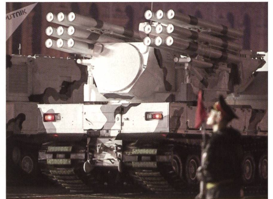
Arktis-Fahrzeug: bereit für die Parade.

Shoigus Chauffeur hatte den Wagen 0001 so präzisiert, dass die Meldung reibungslos vonstatten ging. Dann stieg Shoigu auf die Ehrentribüne zu Präsident