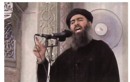
Am 4. Juli 2014 ruft ABB, Abu Bakr al-Baghdadi, in Mosul das Kalifat aus.

Moschee von Mosul rief am 4. Juli 2014 der damals 43-jährige Abu Bakr al-Baghdadi (ABB) das Kalifat aus. Er flüchtete dann ins syrische Rakkah, das Anti-ISIS-Truppen jetzt Schritt um Schritt einschliessen. Der territoriale Endkampf gegen das Kalifat wird primär Syrien heimsuchen.