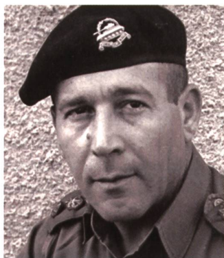
Israel Tal (1924–2010).