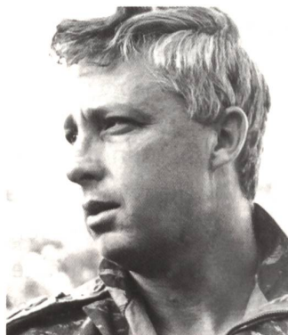
Ariel Sharon (1928–2014).