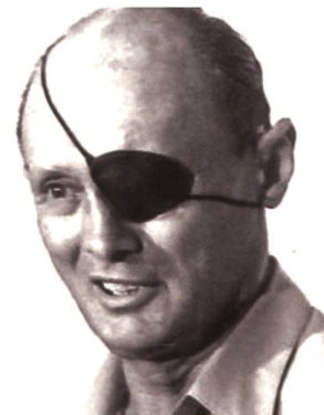
Moshe Dayan (1915–1981).