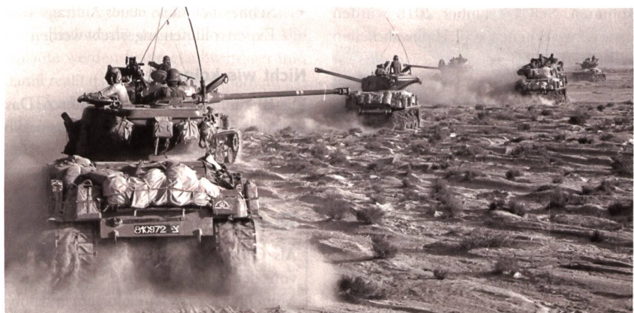
Panzer M4 «Sherman», modifizierte Version mit 105-mm-Kanone, 14. Panzer-Brigade (Ugda Sharon), Verschiebung Richtung Abu Ageila, 5. Juni 1967.

Präzision, Geschwindigkeit und aggressives Führungsverhalten, kombiniert mit dem Verbund aller Waffenmittel, waren die ausschlaggebenden Faktoren für den Erfolg der Israeli. Heute noch gilt der Feldzug im Sinai als Lehrstück moderner Kriegsführung. +