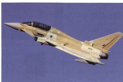
Eurofighter Typhoon für den Oman.

Der erste Eurofighter Typhoon für Oman wurde im BAE Systems Werk Warton zusammen mit einem Hawk Trainer den Gästen vorgestellt. Neben dem stati-