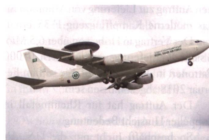
Modernisierung der saudischen Überwachungsflugzeuge E-3A.

Das Radar System Improvement Program für die fünf Boeing E-3A AWACS der saudischen Luftstreitkräfte ist abgeschlossen worden. Nach einem Mustereinbau bei Boeing in Seattle wurden die übrigen vier Flugzeuge bei Alsalam Aerospace Industries in Rijadh umgerüstet, wobei Ingenieure und