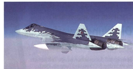
PAK FA T-50 mit neuer Bemalung und Zusatztanks.

Bei der Maschine handelt es sich um den PAK FA T-50-9, er soll Ende April seinen erfolgreichen Jungfernflug gemacht haben. Das russische Verteidigungsministerium hat ein Foto von dem neuesten PAK