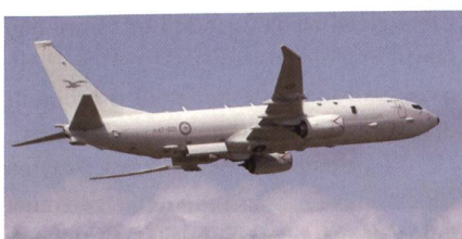
Seeaufklärer P-8A Poseidon.

Die Poseidon Seeaufklärer und U-Bootjäger werden in Neuseeland die älteren P-3K ersetzen. Die Boeing P-8A Poseidon basiert auf der Boeing 737-800 und ist mit modernsten Sensoren für die See-