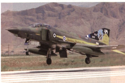
Ausmusterung der RF-4E Phantom II.

Die griechische Luftwaffe hat am 5. Mai 2017 ihre letzten RF-4E Phantom II Aufklärungsflugzeuge offiziell ausgemustert. In Griechenland geht mit der Ausmusterung des letzten Phantoms eine lange Ära zu Ende. Die griechischen Luftstreitkräfte konnten den ersten F-4 Phantom II am 4.