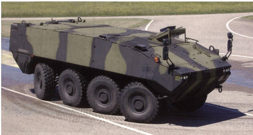
Der Piranha-5 ist bereit.

Vom Mowag-Testgelände bei Bürglen TG berichtet unser Korrespondent Wm Peter Gunz