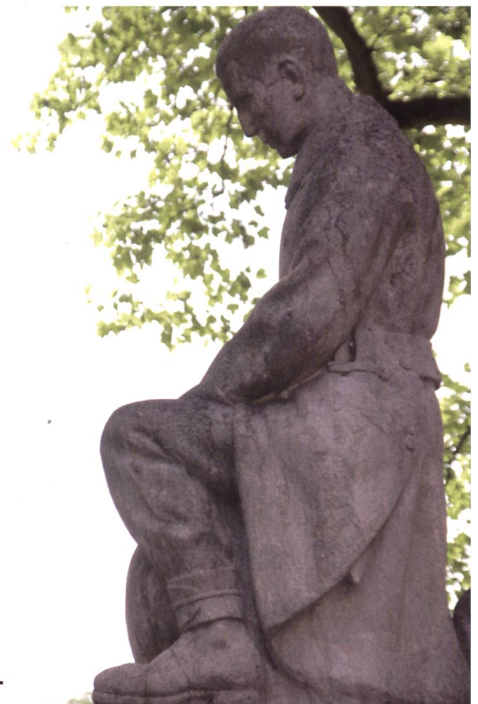
Otto Schilts steinerne Soldat von 1921.