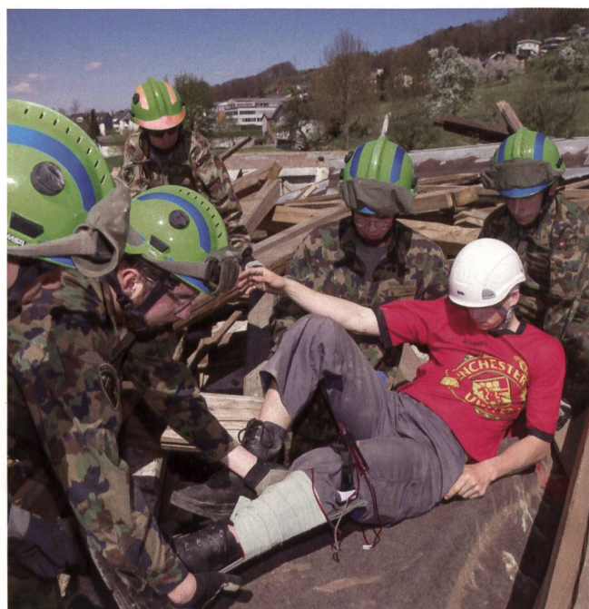
Bergung eines Verschütteten in den Erdbeben-Trümmern von Triengen LU.