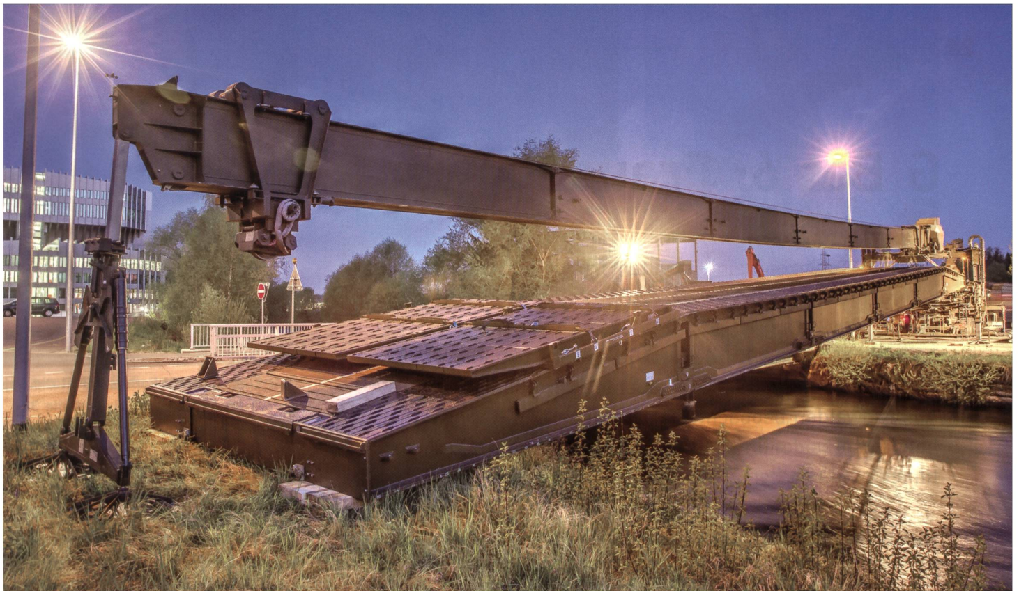
Die 36 Meter lange Unterstützungsbrücke über den Rootkanal.

Bis Dienstag 13 Uhr soll für den Rückzug nach Abschluss der Erdbeben-Berungungsaktion Triengen, bei der ehemaligen Sprengstoff-Fabrik Dottikon eine weitere, diesmal 24 m lange Ustü Brü über die Bünz gebaut werden, damit die Kp nach erfülltem Auftrag auf diesem gesicherten Rückweg den Waffenplatz Bremgarten AG wieder erreichen kann.