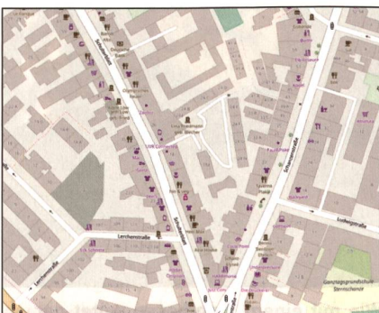
Das Schulterblatt, die wichtigste Strasse, verläuft nach links oben.