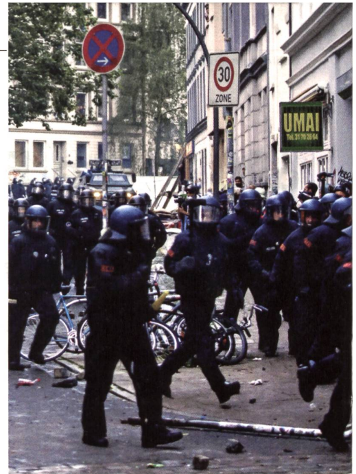
Bereitschaftspolizei im Ammarsch.

Um 8.12 Uhr erlässt die Einsatzzentrale landesweit einen dramatischen Appell. Sie sendet ein Fernschreiben an den Bund und an alle Bundesländer: «Bitte schickt alles, was Ihr habt».