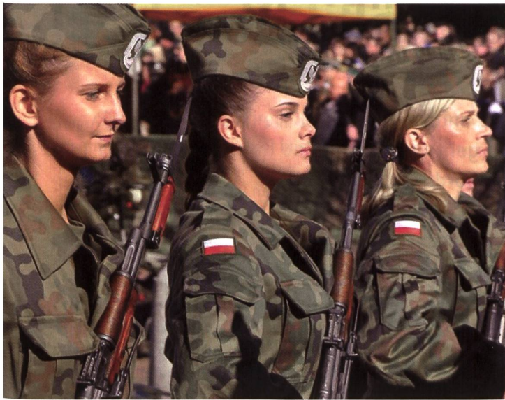
In Polen leisten viele Frauen Militärdienst.