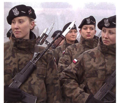
Polen: Ehrengarde erwartet USA.

23 Jahre, nachdem die letzten sowjetischen Truppen Polen verlassen haben, werden Soldaten zur Verstärkung der NATO-Ostflanke in Polen stationiert. Im Rahmen der Operation «ATLANTIC RESOLVE» werden mehr als 4000 Amerikaner nach Polen, Lettland, Litauen und Estland verlegt.