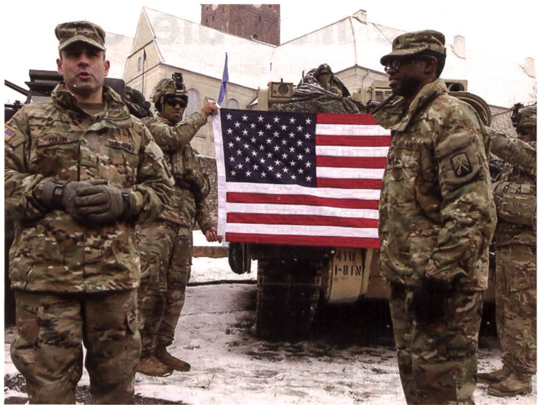
Amerikanische Truppen zeigen in der polnischen Kälte Flagge.