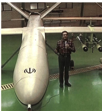
Iranische Kampfdrohne Shahed-129.

Die Drohne Shahed-129 fliegt 2000 km weit und führt auch ausserhalb der iranischen Grenzen Kampfeinsätze durch.