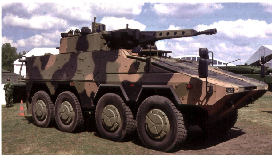
Schützenpanzer Boxer von ARTEC (64% Rheinmetall, 36% KMW).