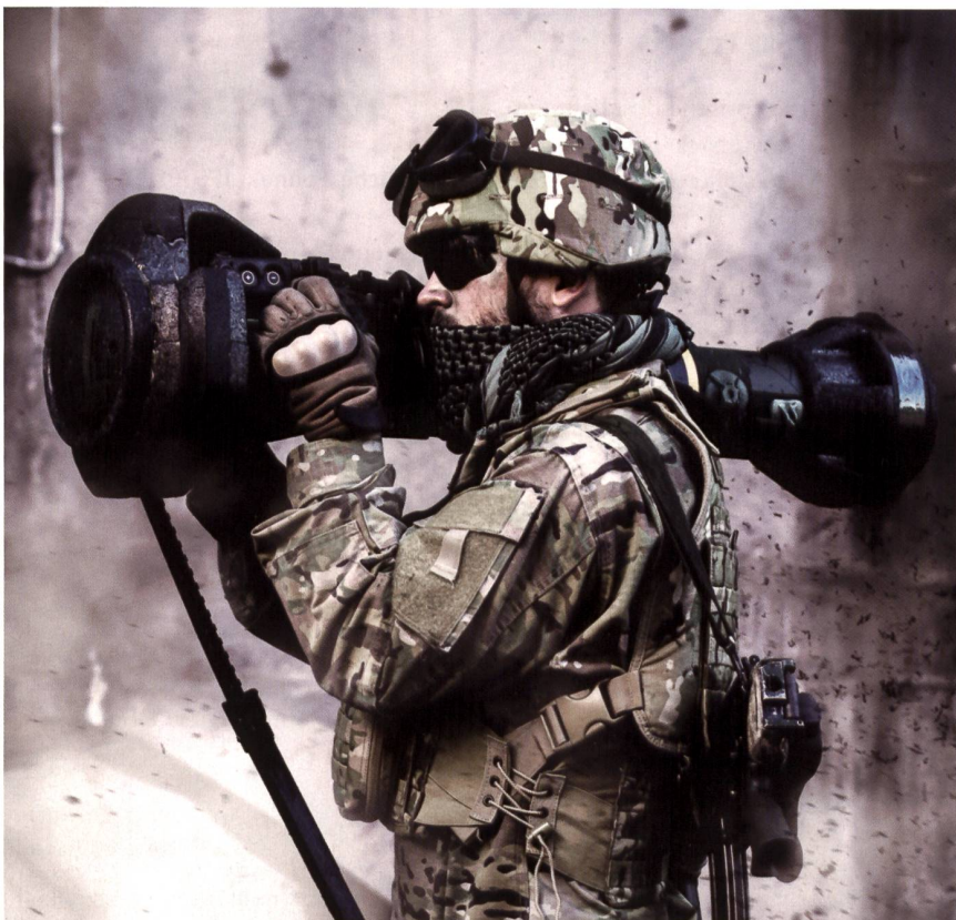
Next Generation Light Anti-Tank Weapon (NLAW) – Ein Auftrag für 115 Millionen.

Um 400 m zu fliegen, benötigt die Rakete knapp zwei Sekunden. Verfehlt die Rakete das Ziel so zerstört sich diese nach einer Flugzeit von 5,6 Sekunden durch Selbstzerlegung. Nach dieser Zeit hat die Rakete 1000 m zurückgelegt.