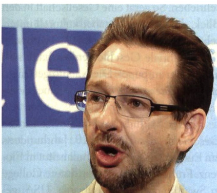
Der neue Generalsekretär der OSZE.