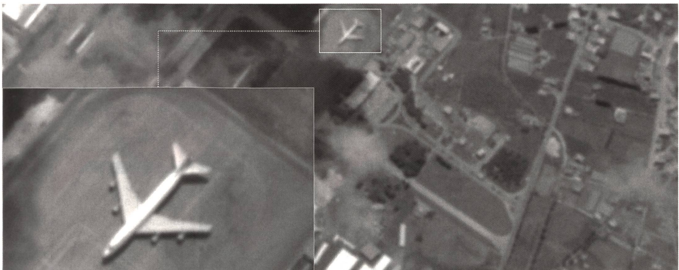
Leider unscharf, als Dokument aber wertvoll: Das Satellitenbild von Hmeimim zeigt in der Mitte eine Boeing 747-200. Iran und Russland ziehen den stillen Umweg über Syrien den auffälligen Direktflügen von Teheran nach Russland vor.