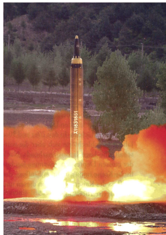
Kim testet: Raketenstart in Nordkorea.