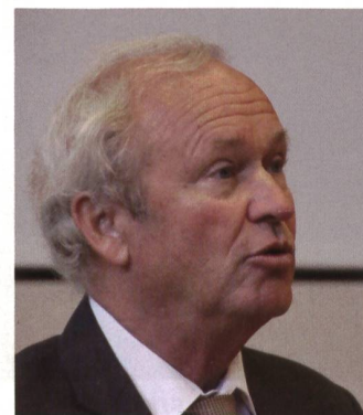
Regierungsrat Winiker, Luzern.